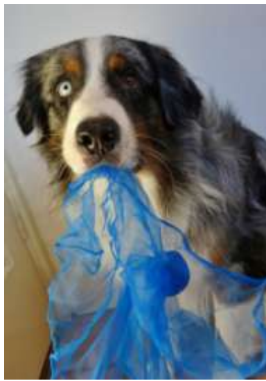
Geeft niets, ik pak hem wel op hoor!